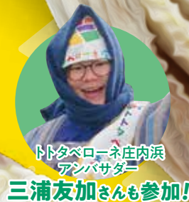
トトタペローネ庄内浜 アンバサダー